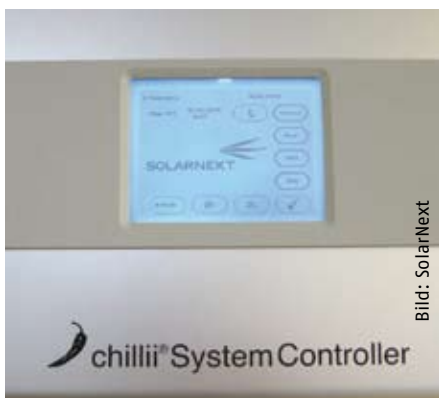
„Chillii System Controller H“ für moderne Heizsysteme.

Diese zentrale Steuerung gehört zu den ersten Systemreglern für komplexe thermische Heizsysteme mit unterschiedlichsten Wärmequellen, mit dem umfangreiche Hydraulikvarianten (mehr als 46000 Varianten) durch ein einziges Gerät regelbar sind. Über den Touchscreen und den integrierten Einrichtungsassistenten können selbst umfangreiche Hydrauliken schnell und einfach abgebildet werden. Komfort- und Ecofunktionen ermöglichen dem Anlagenbetreiber, Anteile und Grenzwerte bevorzugter Energiequellen zu definieren, ohne auf Komfort bei der Heizung zu verzichten.