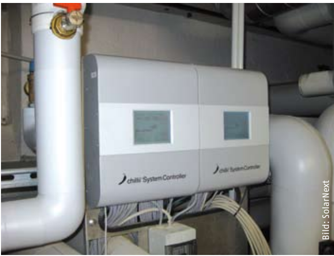
Der System Controller „H“ im Technikraum der B&O-Parkgelände in Bad Aibling.