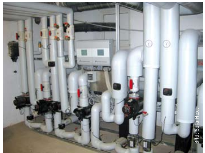
Der System Controller „H“ im Technikraum der Solarzentrale des B&O-Parkgeländes in Bad Aibling.